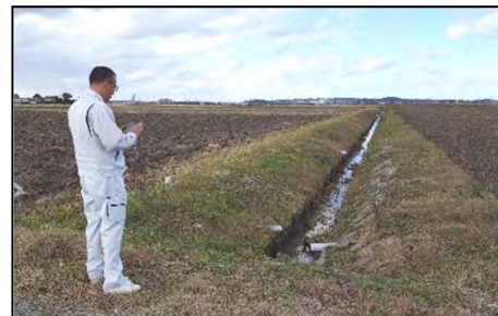
水土里情報システム