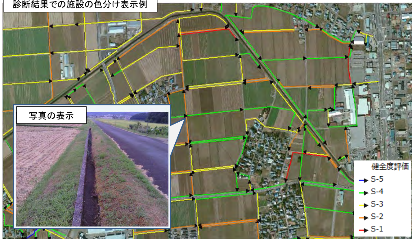
診断結果での施設の色分け表示例